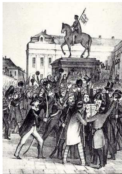
Valóságkép a 1848. március 15-i eseményekről DEK 14 MIEKZ1848.

Ezután a Várba vonultak, hogy a Helytartótanáccsal elfogadtassák követeléseiket. Ez teljes mértékben sikerült, így vér nélkül győzött a forradalom. Az összegyűlt tömeg követelésére Táncsics Mihályt is szabadon bocsátották.