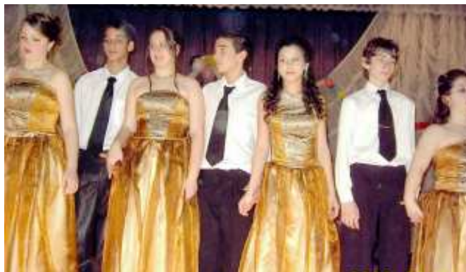
A 8. osztályosok keringőt táncoltak a farsangi bálon. Ezzel a produkcióval léptek fel az óvoda jótékonyági rendezvényén is.