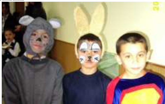
Az iskola farsangi bálján résztvevők kedves jelmezeket öltöttek magukra.