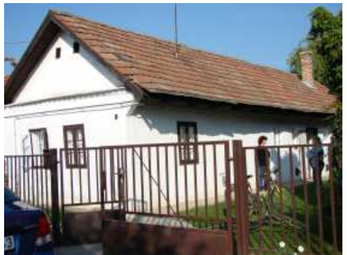
A megvásárolt református imaház a Kossuth út 9. szám alatt.