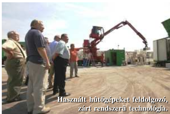
Használt hűtőgépeket feldolgozó, zárt rendszerű technológia.

Világszínvonalú, zárt rendszerű – mobil – technológiát alkalmaznak Jobbágyiban. A gépsor 2X1 hónapig üzemel folyamatos munkarendben a telephelyen. Mielőtt községünkbe érkeznek a kamionok, Norvégiában, Svédországban, Csehországban dolgoznak. A hűtőgépek feldolgozása során a berendezésekből kinyerik a freont, biztonságosan tárolják, majd a dorogi égetőben megsemmisítik azt. A habot vákumos darálóval