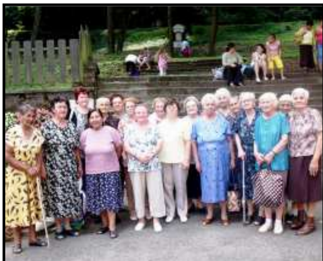
Az Idősek Klubja szervezésében a mátrave- rebélyi Szentkútnál jártak nyugdíjasaink.