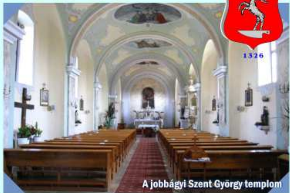
A jobbágyi Szent György templom