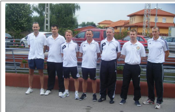
Országos keret 2013.ősz