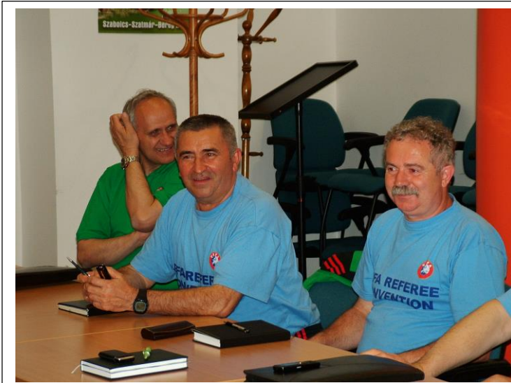
Országos JB ülés